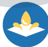
REPELENCIA AL ACEITE