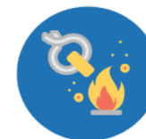
SALPICADURA DE METAL FUNDIDO