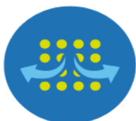
CONTROL DE HUMEDAD