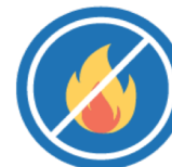
RESISTENTE AL FUEGO