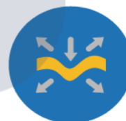
LIBERTAD DE MÓVIMIENTO