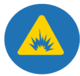
PROTECCIÓN ARCO ELÉCTRICO