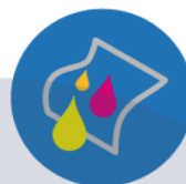
ANTIFLUIDO / REPELENCIA